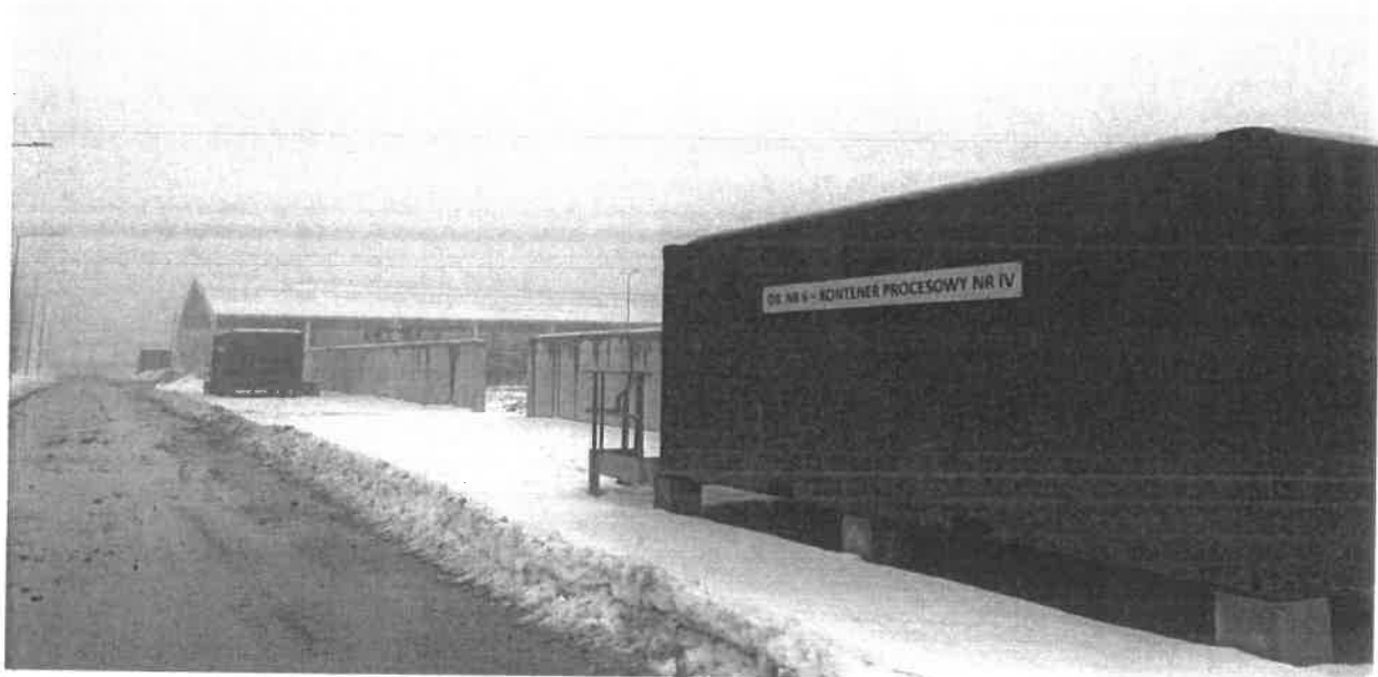
Zdjęcie - punkt nr 3. Kontener procesowy niebieski nr IV zwrócić uwagę czy kontener jest zamknięty.