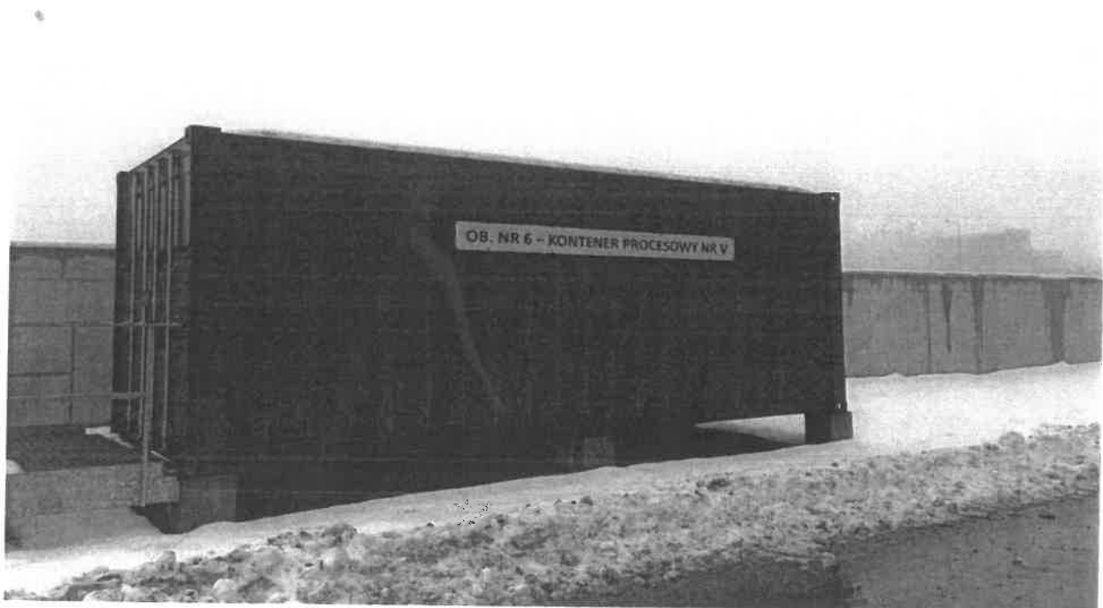
Zdjęcie - punkt nr 4. Kontener procesowy niebieski nr V zwrócić uwagę czy kontener jest zamknięty.